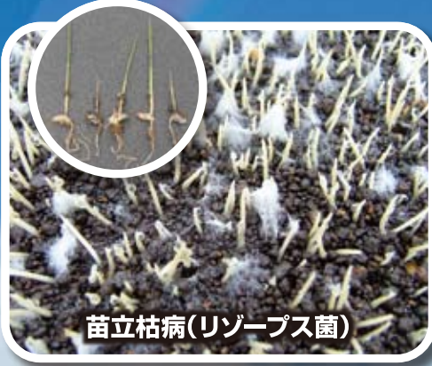
苗立枯病(リゾプス菌)