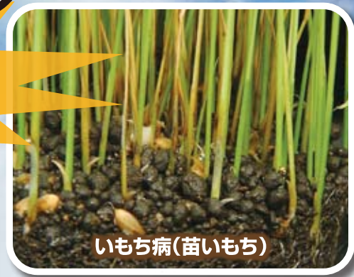
いもち病(苗いもち)