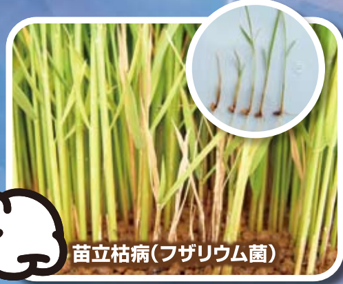
苗立枯病(フザリウム菌)