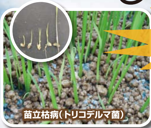
苗立枯病(トリコデルマ菌)